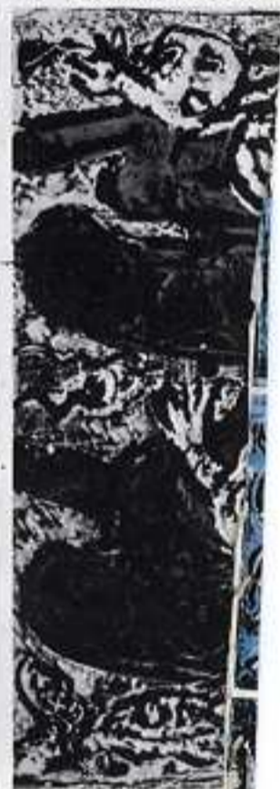
70° episodio, Da

qui sopra 6 episodi ingranditi della "bibbia di nik spatari" illustrata nelle pagine precedenti e, qui accanto l'ottavo episodio di "Noè costruisce l'arca" che l'artista ha eseguito in due forme e nelle dimensioni più grandi, con lo stesso procedimento di colori nitro-metallici e stratificazione, senza spruzzo