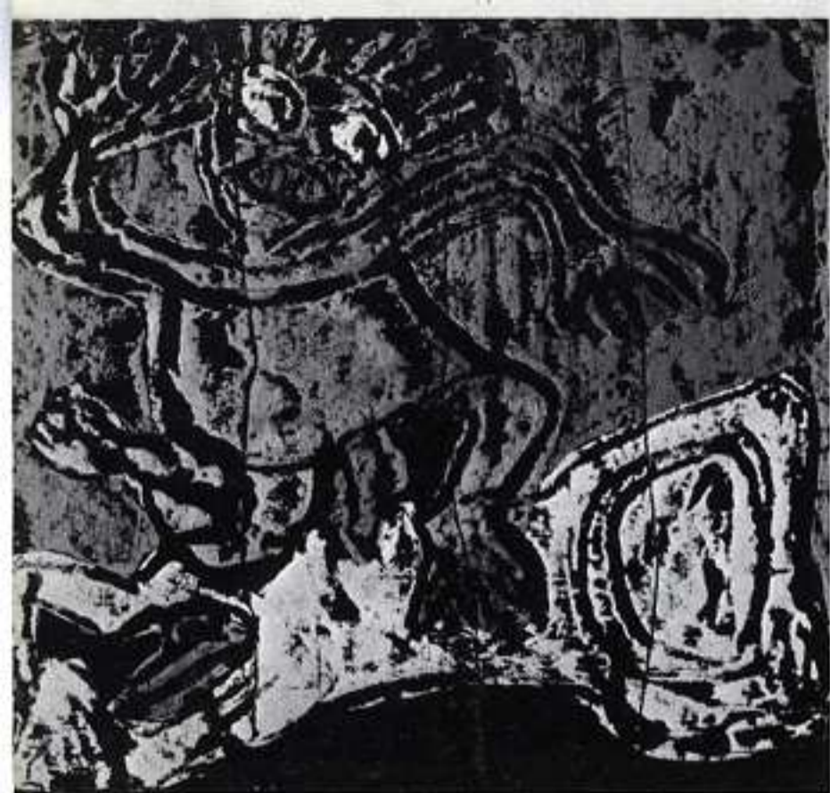
6° episodio, Caino uccide Abele.