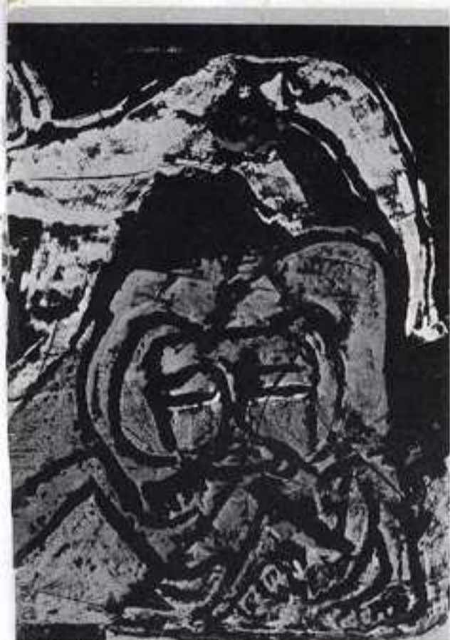
taglia il prepuzio al figlio.