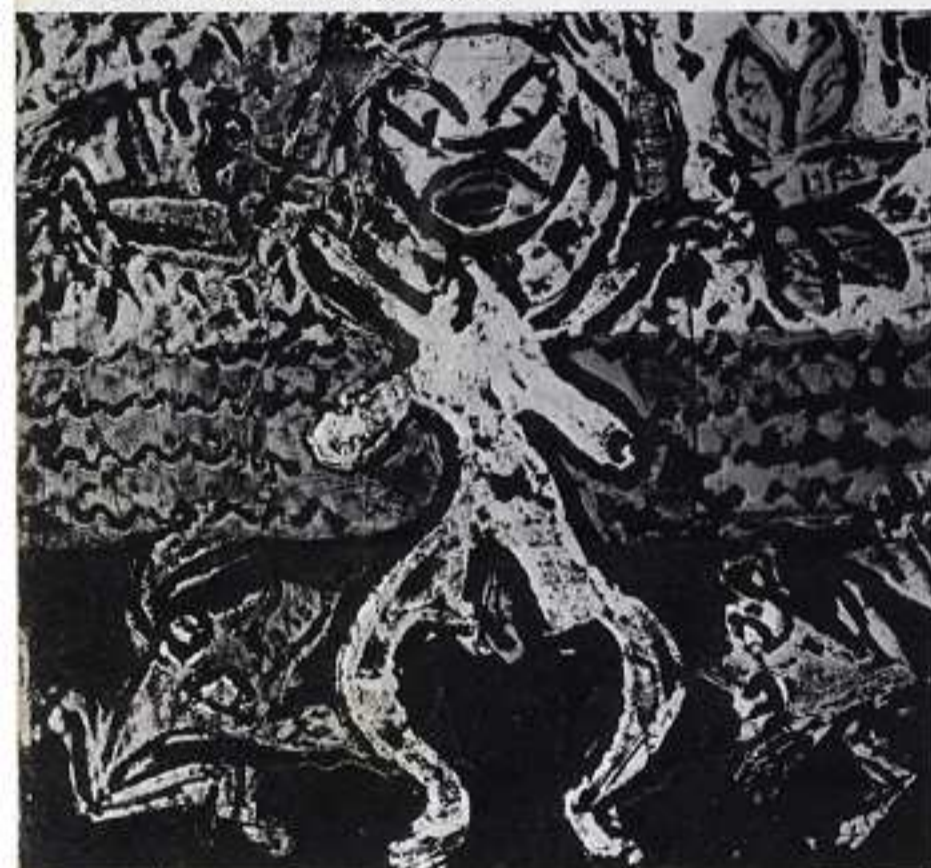
38° episodio, Le piaghe d'Egitto.