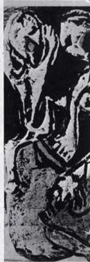
37° episodio, Zippora