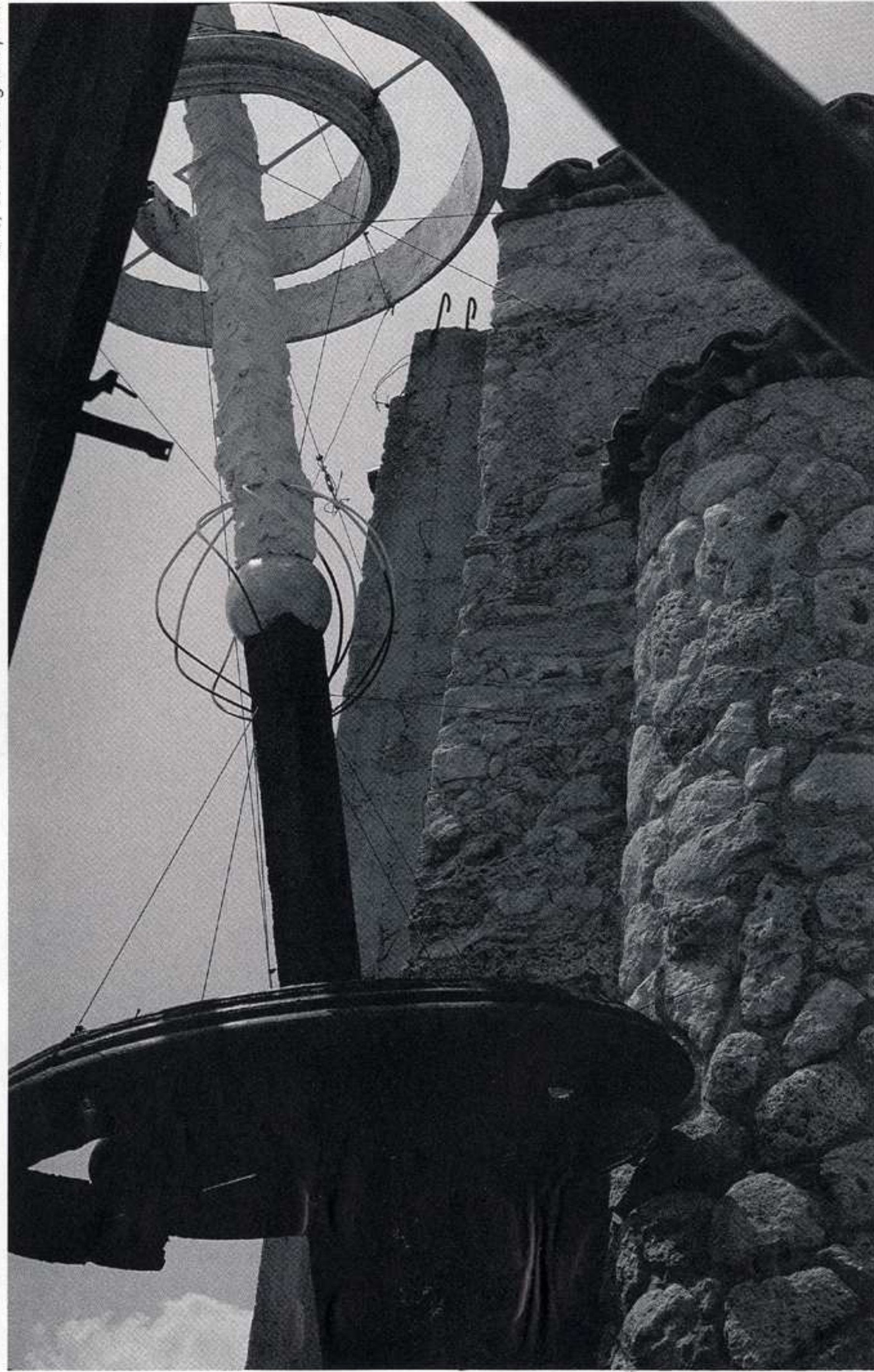
ferro, cemento e legno dipinto